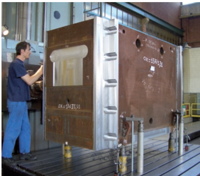
Qualität und Kundenausrichtung haben höchste Priorität.