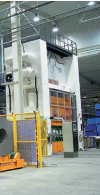
Sämtliche Pressen werden von Balconi kundenindividuell gefertigt, so auch diese Presse samt Coil-Handling für bis zu 1,5 m breite Coils.

Über 5.000 Balconi-Pressen mit bis zu 20.000 kN Presskraft wurden bereits weltweit installiert. Eingesetzt werden die Pressen des italienischen Familienunternehmens insbesondere in Fertigungen, die sowohl eine hohe Präzision als auch eine hohe Geschwindigkeit und Energie benötigen. Zu den Kunden zählen beispielsweise Automobilzulieferer, Lochblechhersteller oder Hersteller von Präzisions-Stanzteilen wie Rotor-Statorpaketen für Elektromotoren.